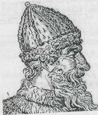
В) Иван III