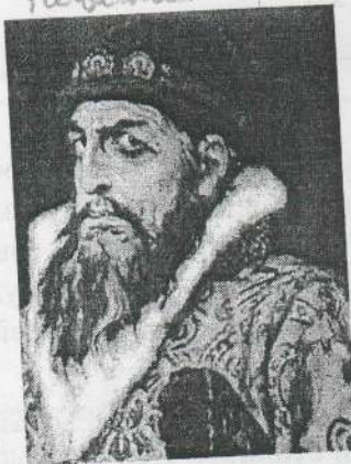
Г) Иван Грозный