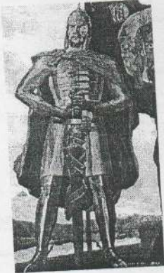
А) Александр Невский