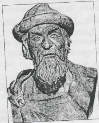
Е) Ярослав Мудрый